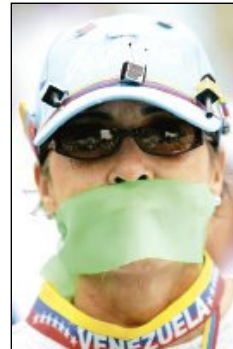
PROTESTAS. Las manifestaciones a favor de 'RCTV' se incrementarán en Caracas. Miles de personas salieron hace dos semanas a hacerlo, en abierto desafío al presidente Hugo Chávez...

Pero esas razones parecen importarle poco al Presidente. Incluso, le restó importancia a una marcha que convocaron hace unos días en Caracas los empleados de la RCTV , periodistas y opositores. "Si yo convocara una marcha para que vengan todos los que apoyan el fin de la concesión, bueno, nos faltarían calles, avenidas y ciudades", celebró Chávez.