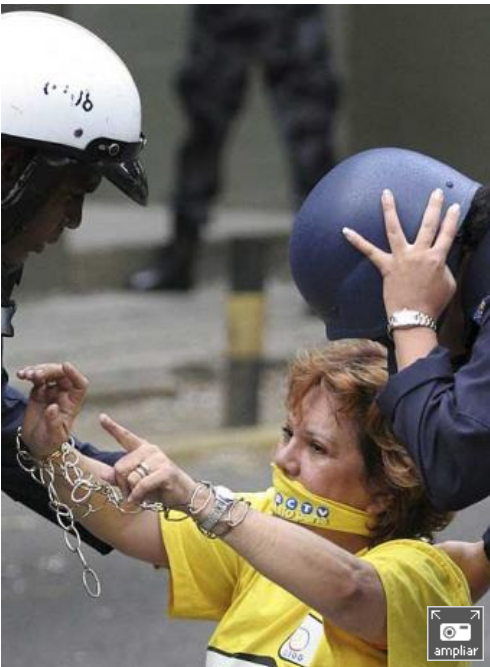
La policía desaloja a una de las participantes de la manifestación contra el cierre del canal RCTV

La cadena privada Radio Caracas Televisión (RCTV) ha apagado su señal de emisión en abierto esta noche a las 23.59 hora local (5.59 hora peninsular española), al no serle renovada la concesión de frecuencia estatal por el gobierno venezolano. Como estaba previsto, el canal más antiguo de la televisión en Venezuela ha salido del aire tras 53 años de emisión en el canal 2, frecuencia que utilizará a partir de hoy la cadena Teves, creada por el gobierno del presidente Hugo Chávez.