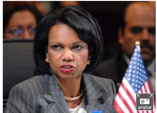
La secretaria de Estado de EE UU, Condoleezza Rice, ha pedido en la XXXVII Asamblea General de la OEA que ese organismo continental envíe una comisión a Venezuela para investigar la no renovación de la licencia de transmisión del canal RCTV.

Estados Unidos ha afirmado que mantiene en pie su exigencia de que el gobierno de Venezuela autorice la salida al aire en señal abierta de la cadena privada Radio Caracas Televisión (RCTV), cuya licencia de transmisión venció el 27 de mayo.