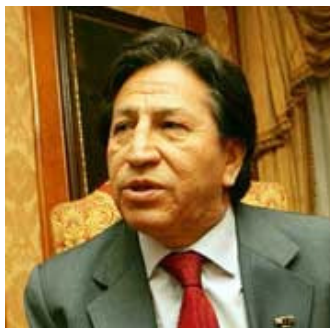
Alejandro Toledo.

En un artículo publicado hoy por el diario The New York Times bajo el título "Silencio=Despotismo", Toledo señaló que en el caso de RCTV, que dejó de transmitir en señal abierta el 27 de mayo pasado, "se trata de algo más que una estación de televisión.