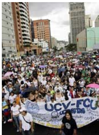
Estudiantes marchan en Caracas por la libertad de expresión. Los docentes manifestaron su apoyo.