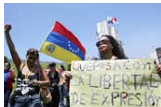
Periodistas en contra de la cancelación de Radio Caracas Televisión (RCTV) expresan su repudio a la medida adoptada por el presidente de Venezuela Hugo Chávez.

Por ello, en una reunión con los periodistas extranjeros acreditados en Lima, el gerente de prensa internacional de RCTV y moderador del programa “La Entrevista” solicitó al presidente Hugo Chávez que reconsidere su decisión y renueve la licencia al canal.